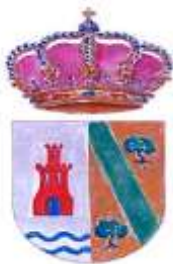
Ayuntamiento de Argés